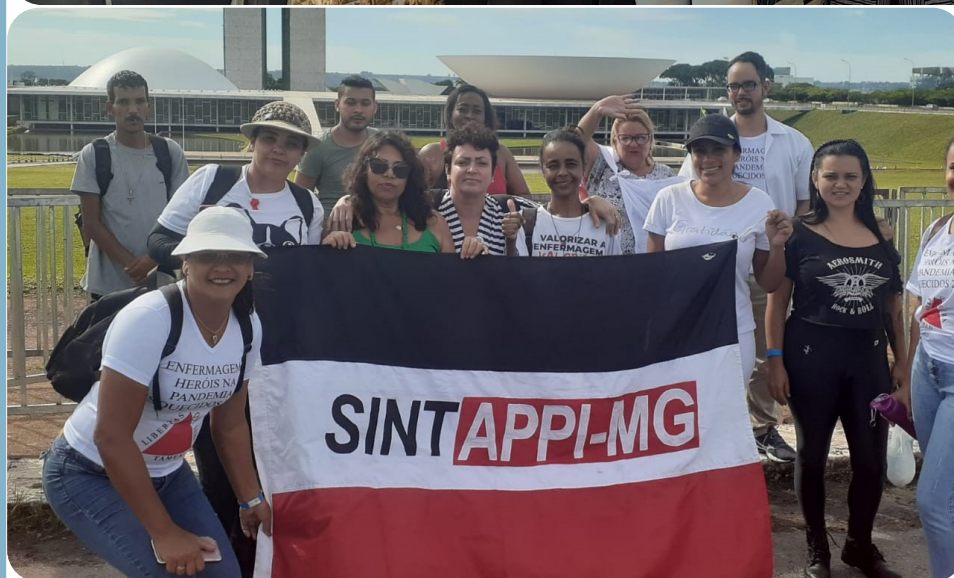
Ato Nacional da Enfermagem - Pág 3