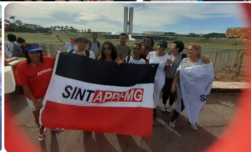
Golpe Militar - Pág 4