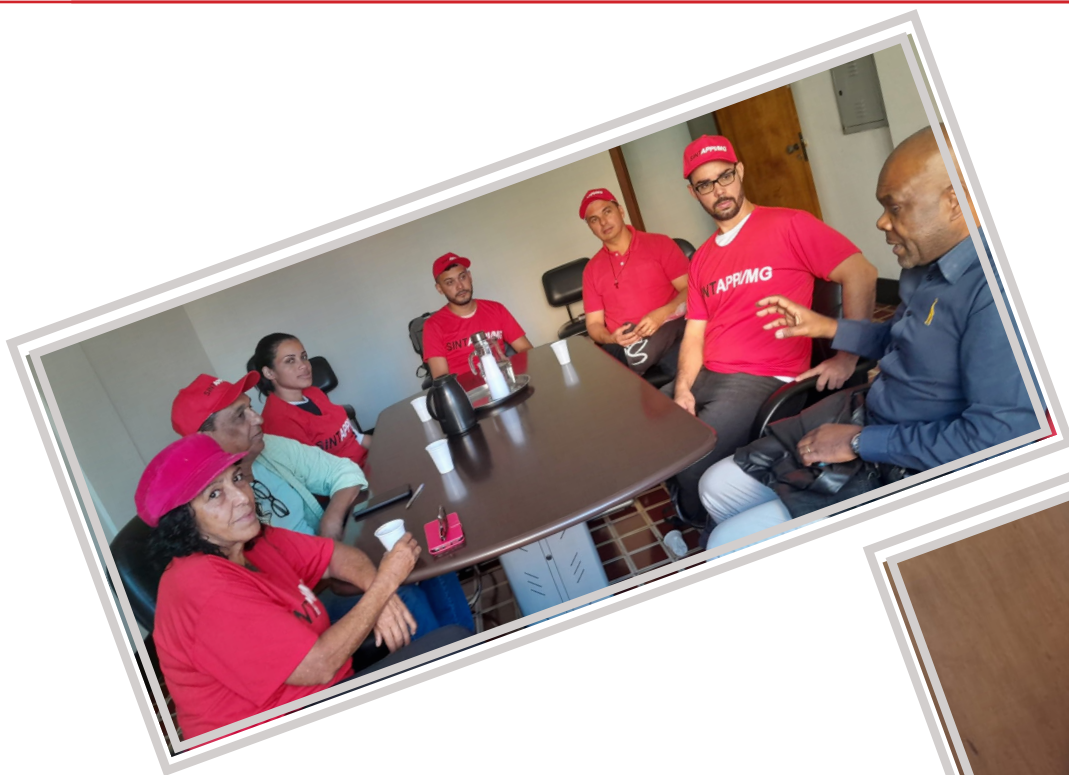
Reunião dos Diretores do SINTAPPI-MG e Delegados Sindicais da Upa Centro - Sul e do Hospital Risoleta Tolentino Neves (HRTN)